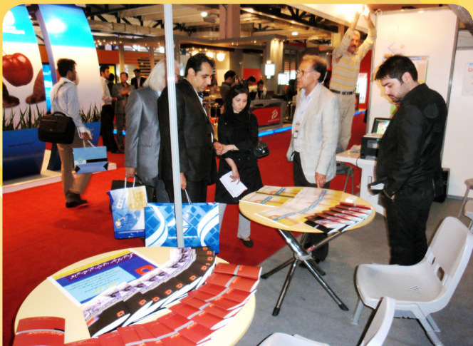
اعضای کانون در نمایشگاه بورس، بانک و بیمه