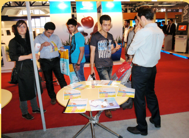
جوآنان در غرفه کانون در ششمین نمایشگاه بورس، بانک و بیمه - ۱۹ تا ۲۲ اردیبهشت ۹۱