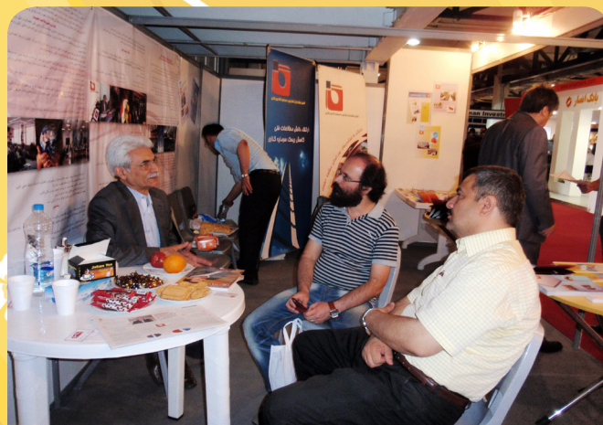
با مدیران ماهنامه بازار و سرمایه در غرفه کانون در ششمین نمایشگاه بورس، بانک و بیمه