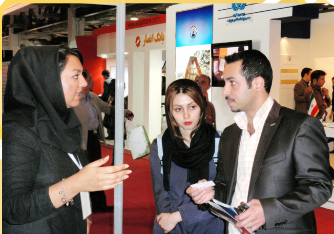
غرفه کانون در ششمین نمایشگاه بورس، بانک و بیمه - ۱۹ تا ۲۲ اردیبهشت ۹۱