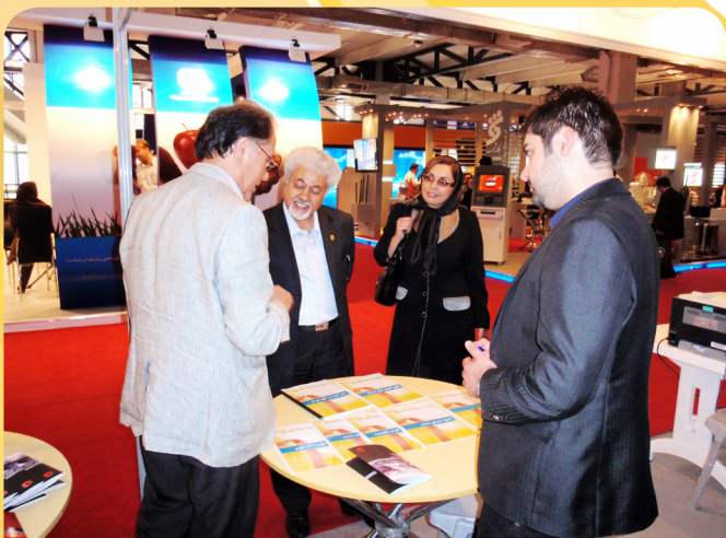
اعضای کانون در نمایشگاه بورس، بانک و بیمه