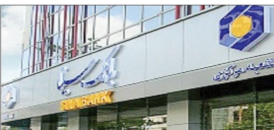
تاکید کرده اند.

بانک سینا در سال گذشته ۶۷۶ میلیارد ریال تسهیلات در اختیار شرکت های دانش بنیان قرار داد و همچنین ۸۹۸ میلیارد ریال ضمانت نامه برای این نوع شرکتها صادر کرد. این بانک در بخش تسهیلات اعطایی به شرکت های دانش بنیان ۴۵۰۰ میلیارد ریال هدف گذاری کرده که نسبت به سال گذشته ۶۶۶ درصد رشد داشته است، در بخش ضمانت نامه ها نیز ۳۰۰۰ میلیارد ریال در نظر گرفته که رشد ۳۳۴ درصدی نسبت به سال گذشته را نشان می دهد.