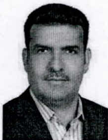
Fanoos Khial 3341L