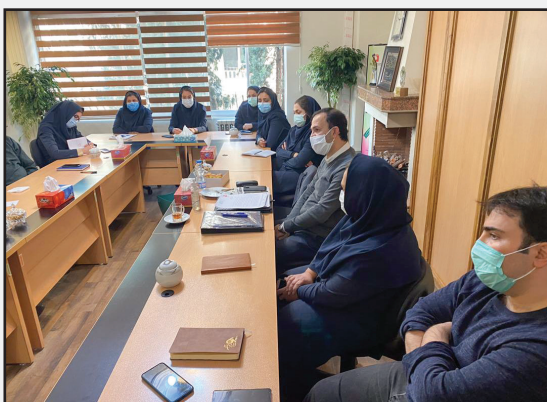
سوابق حرفه ای و تخصصی نامبرده در خبرهای بعدی به آگاهی اعضای کانون می رسد.